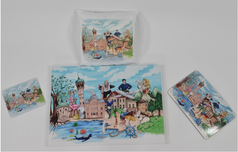
Sibel Nazlı MANSİYON