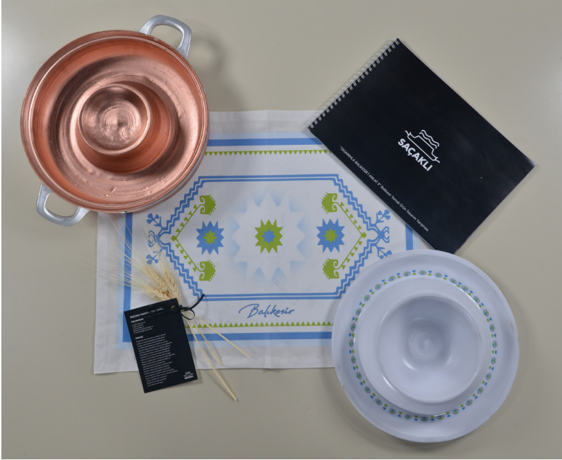
Armağan Sözer ÜÇÜNCÜ